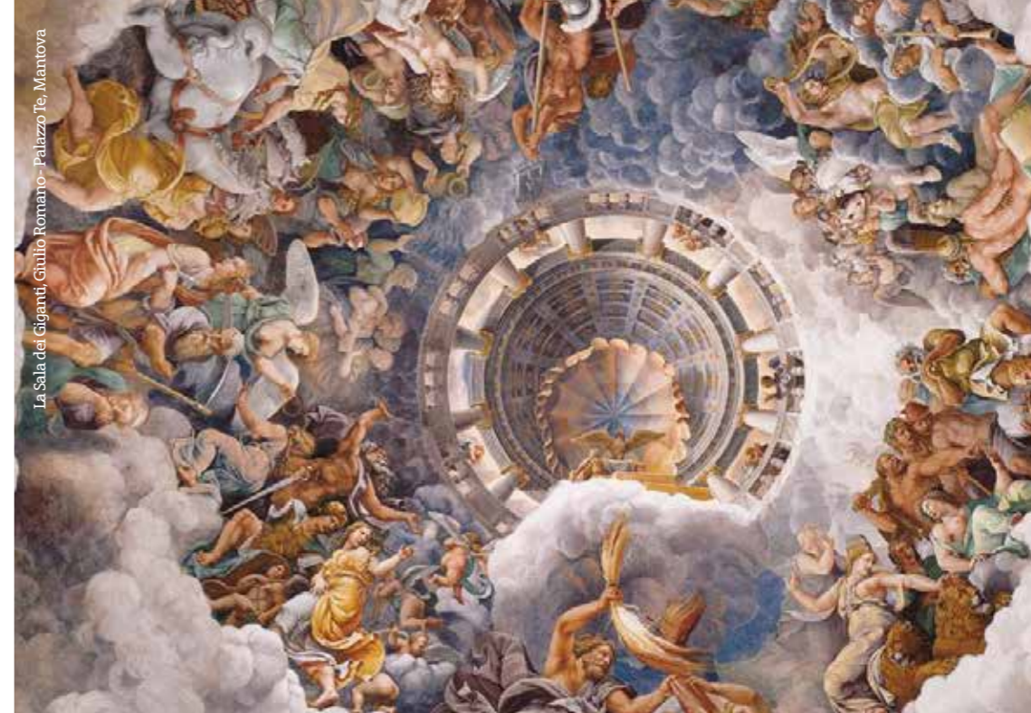
La Sala dei Giganti, Giulio Romano - Palazzo Te, Mantova