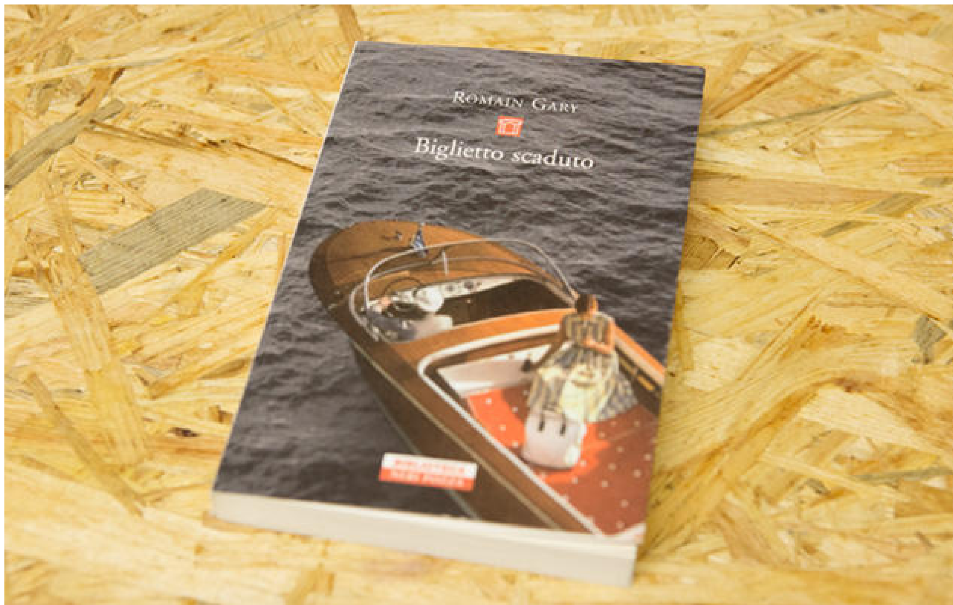
Biglietto scaduto – Romain Gary